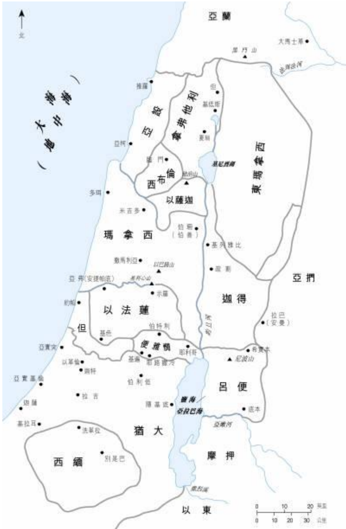
圖一：士師時期的十二支派勢力分佈