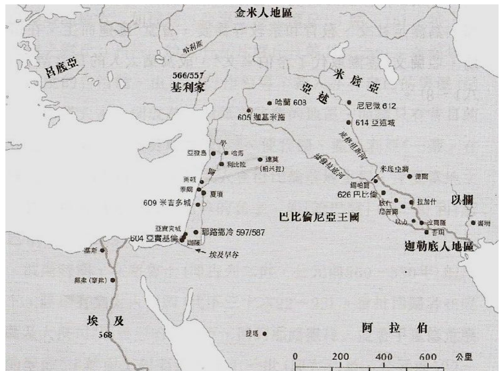
右圖：巴比倫、亞述、埃及位置圖。