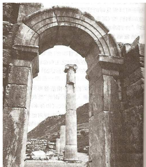
保羅經常講道的地方—推喇奴的廊院，位於以弗所運動場中，有人稱它為最早的神學院。